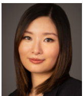
Me Yezhou Shen Municonseil avocats Montréal